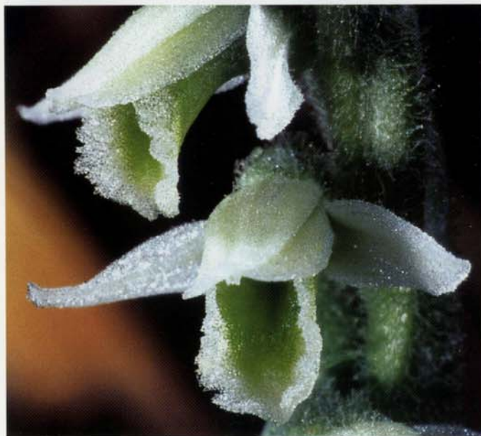
Einzelblüten von Spiranthes spiralis

Die Herbst-Drehwurz ist der Spätblüher unter unseren einheimischen Orchideen. Die Blütezeit wird je nach Wuchsort von Ende August bis sogar Anfang Oktober angegeben, scheint sich in den letzten Jahren aber deutlich vorzuerlagern.