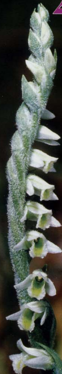
Herbst-Wendelähre Spiranthes spiralis (L.) CHEVALL.